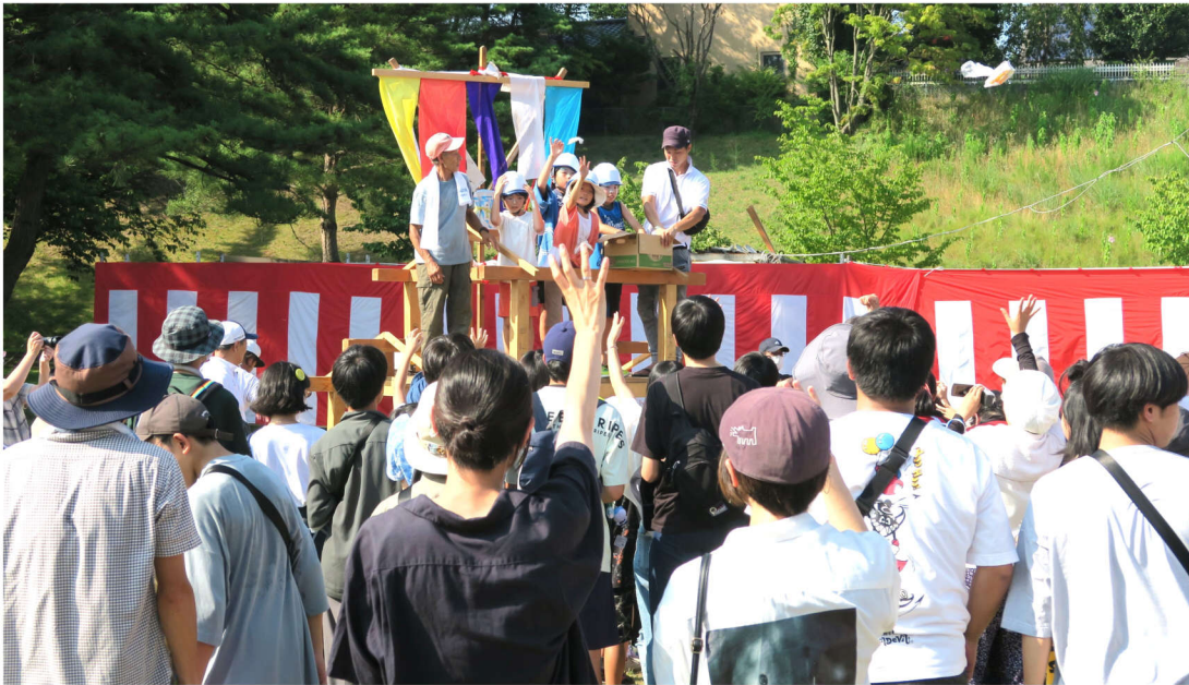
上棟セットの上からお祭りに来ていた子どもたちがお菓子まき