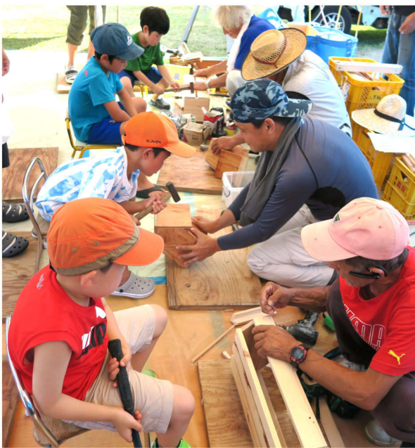
次から次へと大工さんは大忙し