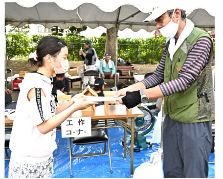
修了証書を受け取って

平らで無い為に隙間が空き、大 工さんたちが汗だくになりなが ら上手く調整し、組み上げてい ました。出来上がった上棟キッ トの上に5人の子どもに上がっ てもらいお菓子をまいてもらい ました。大人も子どもも大はしゃ ぎで、拾う姿に疲れも一気に吹 き飛びました。 たくさんの人たちが来て下さ り、地区の方々には「来年も是 非に」と声をかけて頂きました。