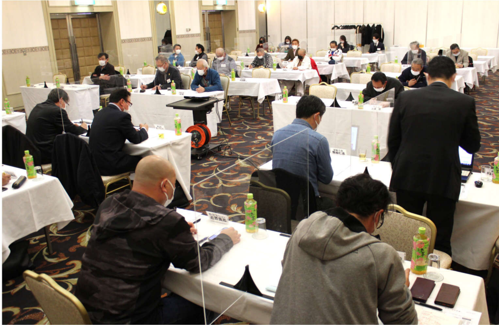
役員と分会長38名がサンセール盛岡にて

発行所 盛岡建設労働組合 盛岡市本宮一丁目7番27号 電話 019-631-1707 FAX 019-631-1706 教宣部・青年部