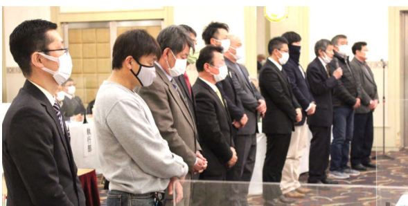
役員改選で選任された執行委員

副組合長として2期目となりました。組合員の皆様の協力を得ながら組合運動に取り組みたいと思っております。建設業が厳しい状況の続く中、組合の運営も厳しさを増すと思っております。そのためにも組織拡大で財政も潤い、組合も活性化します。組合長を補佐し新役員とともに勉