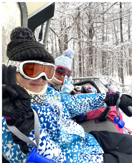
リフトに乗ってちょっと休憩

盛岡建設労働組合の第74回定期大会は、前号の告示で掲載しました通り2月19日(日)にサンセール盛岡にて開催致します。参加される方はマスク着用等の新型コロナウイルス感染拡大防止対策に留意してご参加願います。何卒ご理解とご協力の程よろしくお願致します。